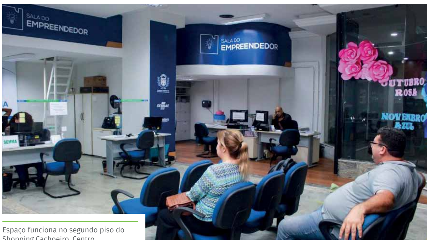
Espaço funciona no segundo piso do Shopping Cachoeiro, Centro

A Sala funciona das 9h às 18h, no Shopping Cachoeiro (2º piso), Centro, e atende pelos telefones (28) 3522-4445 e (28) 98817-5732 (Whatsapp) para demandas relacionadas ao NossoCrédito. Demais assuntos devem ser tratados pelo número (28) 3155-5292.