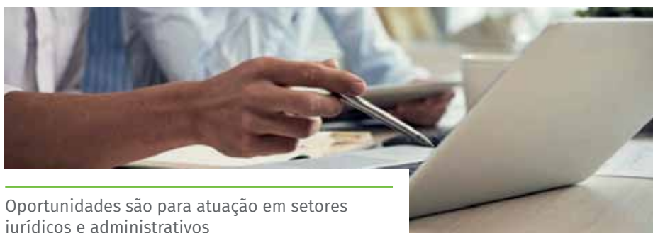
Oportunidades são para atuação em setores jurídicos e administrativos

Para mais informações e esclarecimentos, é possível contactar o Procon pelo telefone (28) 3155-5262.