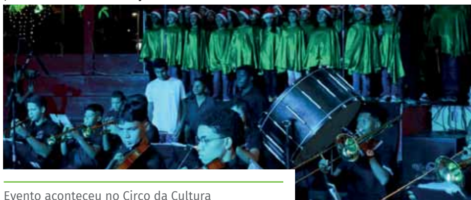
Evento aconteceu no Circo da Cultura