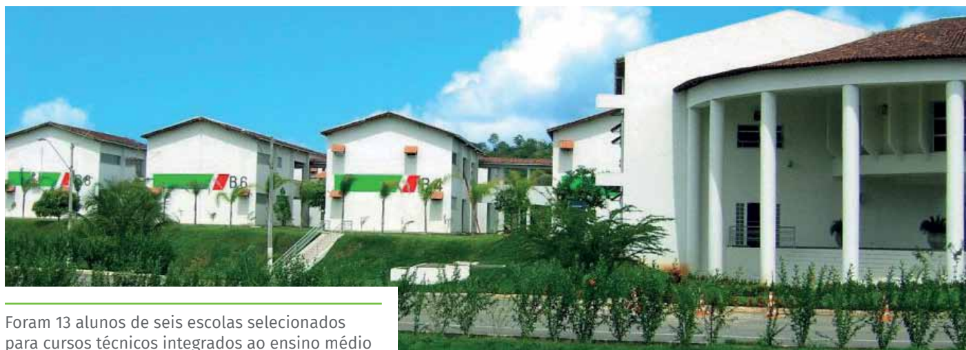
Foram 13 alunos de seis escolas selecionados para cursos técnicos integrados ao ensino médio