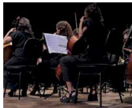
Diversos projetos culturais foram beneficiados