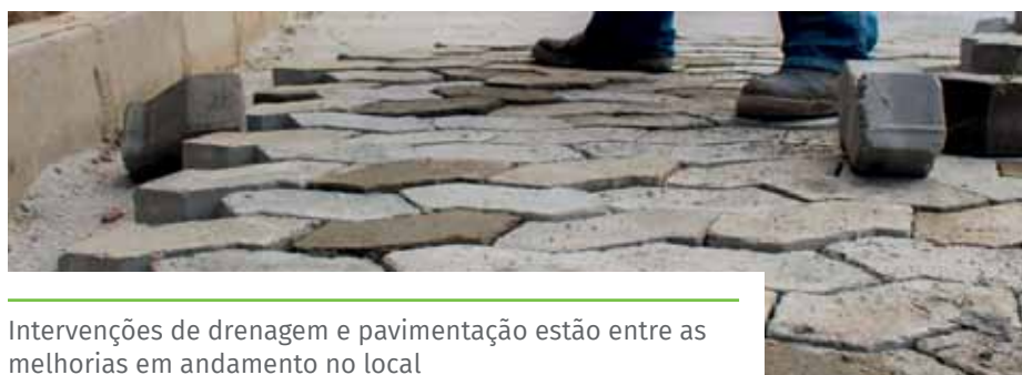
Intervenções de drenagem e pavimentação estão entre as melhorias em andamento no local