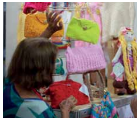
Visitantes podem adquirir diversos tipos de produtos produzidos de forma manual

na Praça de Fátima, o público também pode aproveitar a decoração de Natal preparada pela Prefeitura. São diversos atrativos para toda a família, como casa do Papai Noel, máquina de neve cenográfica, esculturas diversas, variedade de luzes pisca-pisca e a árvore de Natal da cidade, que neste ano conta com uma passagem interna em sua estrutura.