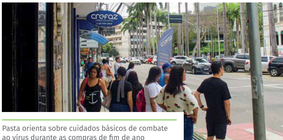
Pasta orienta sobre cuidados básicos de combate ao vírus durante as compras de fim de ano

Periodicamente, a Semus realiza mutirões de vacinação aos fins de semana, em locais e horários alternativos. Essas ações são previamente divulgadas por meio dos canais oficiais da Prefeitura de Cachoeiro.