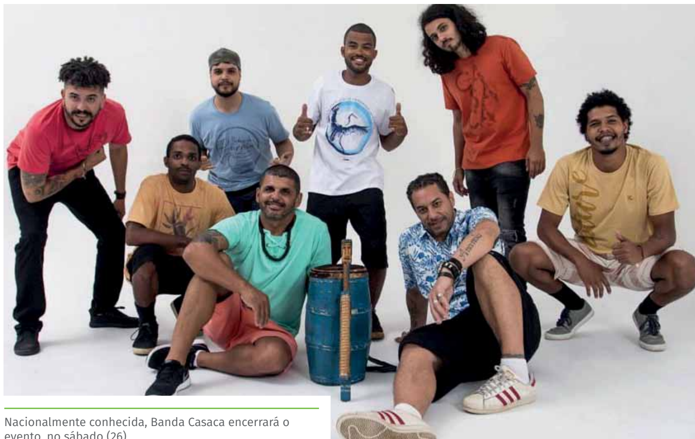
Nacionalmente conhecida, Banda Casaca encerrará o evento, no sábado (26)

O evento Wakanda Cachoeiro, que será realizado neste fim de semana, na Praça de Fátima, em comemoração ao mês da Consciência Negra, estará repleto de atrações culturais para o público.