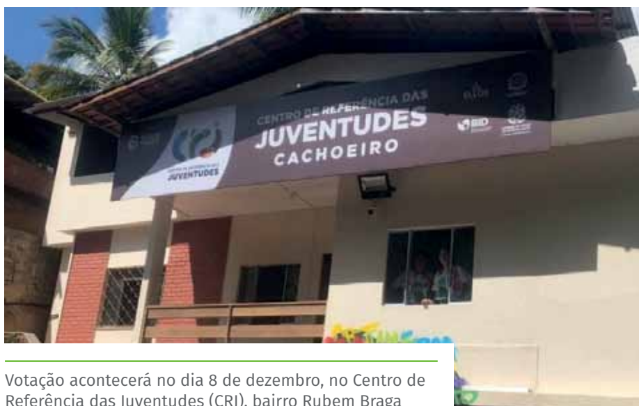
Votação acontecerá no dia 8 de dezembro, no Centro de Referência das Juventudes (CRJ), bairro Rubem Braga

Além disso, é preciso que os postulantes pertençam a uma entidade reconhecida com atuação na área de juventude ou fazer parte de movimentos populares da respectiva política pública à qual pretende representar e outras