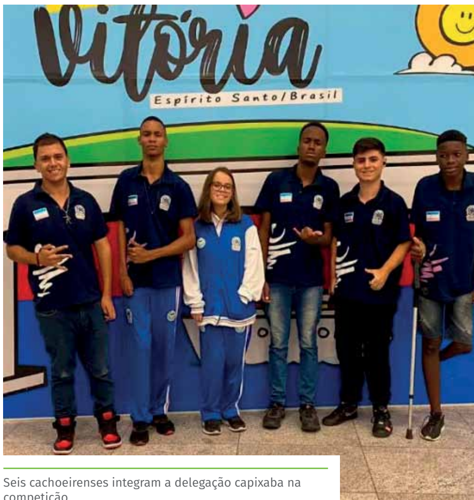
Seis cachoeirenses integram a delegação capixaba na competição

Seis jovens paratletas cachoeirenses integram a delegação capixaba que disputa a edição 2022 das Paralimpíadas Escolares, em São Paulo, aberta na última segunda-feira (21).