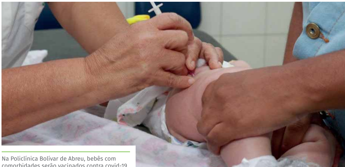
Na Policlínica Bolívar de Abreu, bebês com comorbidades serão vacinados contra covid-19

No próximo sábado (26), das 8h às 12h, tem novo Dia D de multivacinação, em Cachoeiro de Itapemirim. O foco será a atualização do cartão de vacinas para pessoas de dois meses a 14 anos, 11 meses e 29 dias; vacinação contra a covid-19, a partir de cinco anos e contra a meningite sorotipos ACWY, até 29 anos.