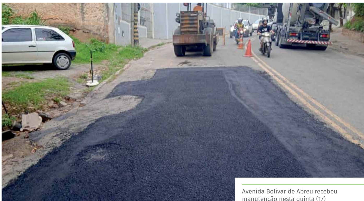
Avenida Bolívar de Abreu recebeu manutenção nesta quinta (17)

Para melhorar as condições de tráfego na avenida Bolívar de Abreu, até que as obras sejam iniciadas, a via recebeu serviços de manutenção, nesta quinta-feira.