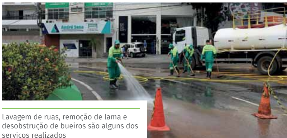
Lavagem de ruas, remoção de lama e desobstrução de bueiros são alguns dos serviços realizados

Os cidadãos também podem procurar os canais digitais, a qualquer dia e horário, para registrar suas manifestações: Portal do Cidadão, ( www.cachoeiro.es.gov.br/ouvidoriageral ), aplicativo de celular “Todos Juntos” e WhatsApp Cachoeiro Online (98803-9552), opção 1.