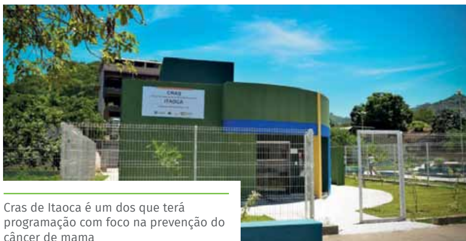
Cras de Itaoca é um dos que terá programação com foco na prevenção do câncer de mama