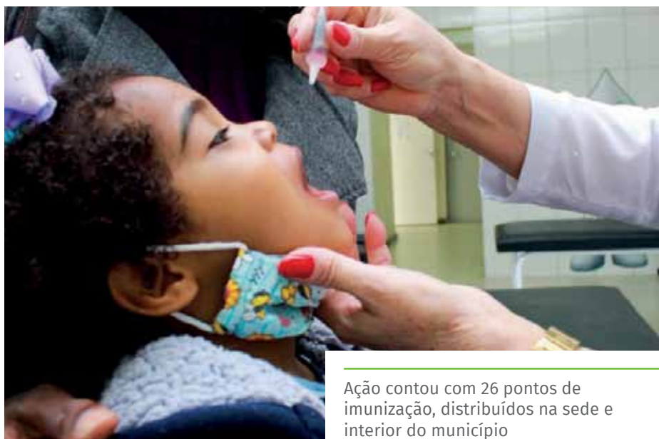
Ação contou com 26 pontos de imunização, distribuídos na sede e interior do município

UBS Soturno UBS Burarama UBS Pacotuba UBS Córrego dos Monos UBS Itaoca UBS Conduru