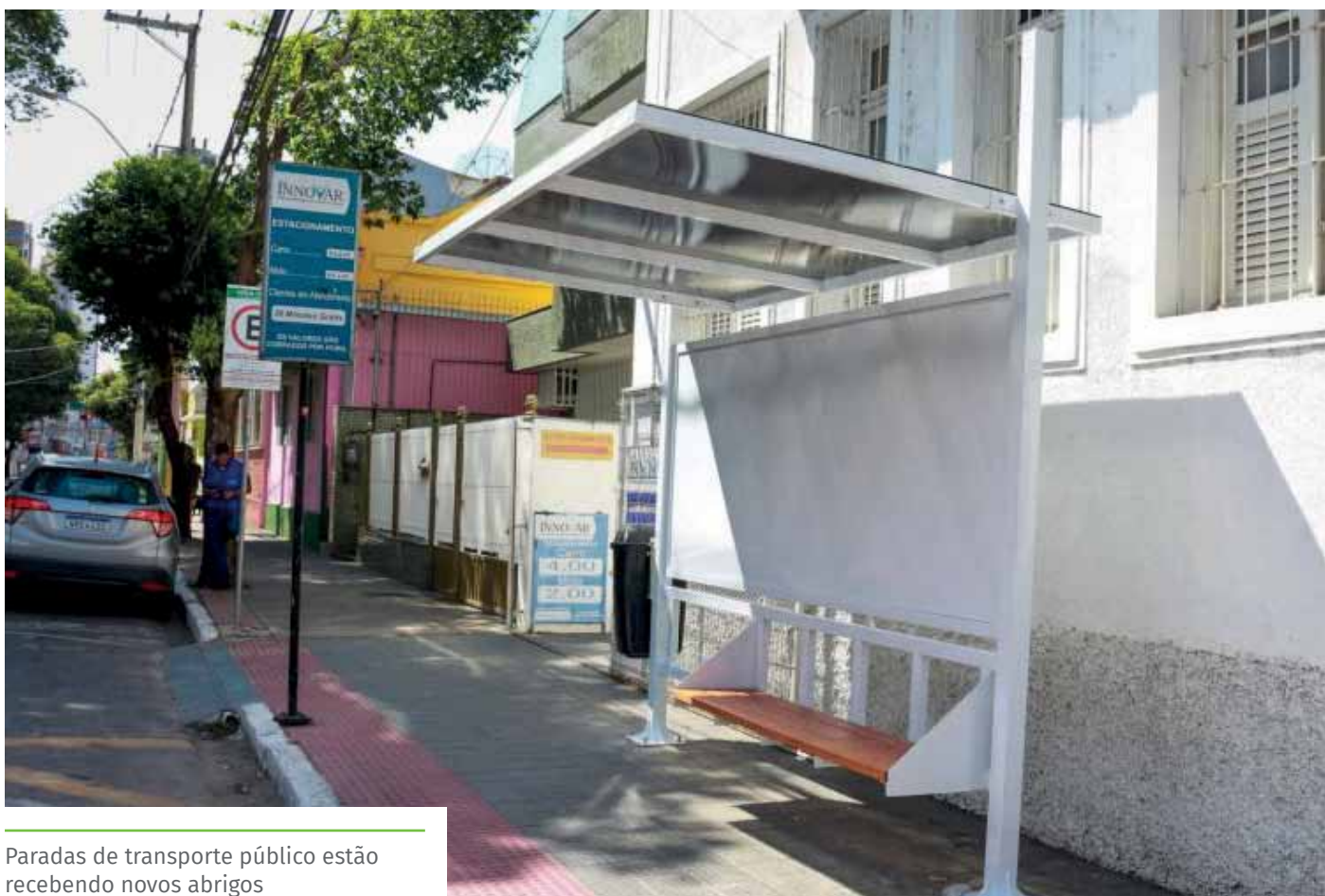
Paradas de transporte público estão recebendo novos abrigos