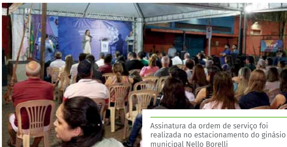
Assinatura da ordem de serviço foi realizada no estacionamento do ginásio municipal Nello Borelli

Os serviços serão realizados por uma empresa contratada pela Prefeitura, via processo licitatório. O prazo de conclusão é de 365 dias.