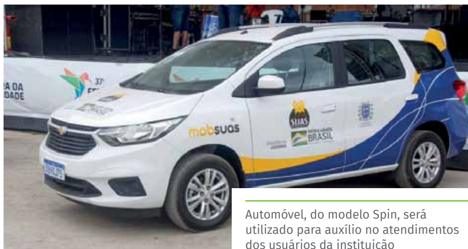
Automóvel, do modelo Spin, será utilizado para auxílio no atendimentos dos usuários da instituição

Chamado PediaSuit, o tratamento beneficia pacientes com funções motoras comprometidas, como paralisia cerebral, atraso no desenvolvimento, lesões traumáticas cerebrais, entre outros. O programa, intensivo e individual, visa o ganho de força, funcionalidade, coordenação e equilíbrio.