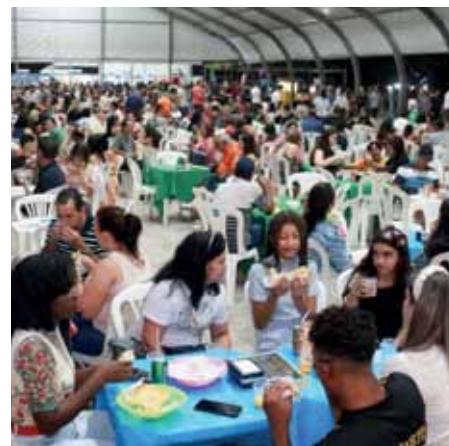
Público marcou presença no Parque de Exposição do Aeroporto

Ao todo, foram arrecadados 1.062,3 quilos de donativos, que serão destinados ao Banco de Alimentos, responsável por distribuir cestas de alimentos a famílias em vulnerabilidade social e a organizações de assistência social.