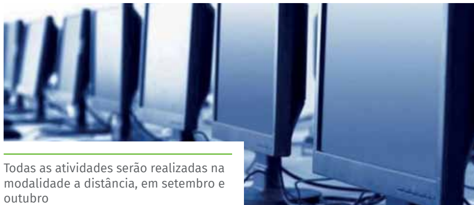
Todas as atividades serão realizadas na modalidade a distância, em setembro e outubro

Competências Básicas: O curso disponibiliza informações sobre as políticas públicas, na área da educação, executadas pelo governo federal, o financiamento dessas políticas e o papel do FNDE no apoio à efetivação dessas políticas.