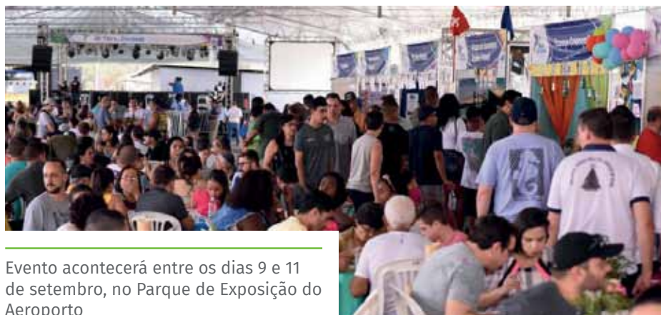
Evento acontecerá entre os dias 9 e 11 de setembro, no Parque de Exposição do Aeroporto

Cachoeirense (Assobec) Associação Teatral de Cachoeiro (Asteca) Cáritas Diocesana da Diocese de Cachoeiro de Itapemirim Centro de Defesa dos Direitos Humanos (CDDH) Comunidade Beneficente Espírita do Amor (COBEA) Comunidade Nossa Senhora Aparecida Monte Belo Criança Feliz Brinquedo Sim Criança Feliz Le Pesto Encontro Conjugal Paróquia São Pedro Espaço Criança Feliz Estrela do Norte Futebol Clube Federação das Associações e Movimentos Populares (FAMMOPOCI) Festa das Crianças Coramara Grupo Escoteiro Baden-Powel Grupo Folclórico Tsunami Igreja Assembleia de Deus Manancial de Bênçãos Igreja Missionária Canaã Igreja Evangélica Missionária Vale das Bênçãos Natal Solidário Núcleo Pedra Paróquia Nossa Senhora da Graça Programa de Promoção e Assistência Social Casa Verde Projeto Bem-Me-Quer Feliz Projeto Mova-se Projeto Nossa Criança Rotary Club de Cachoeiro de Itapemirim Santa Casa de Misericórdia Projeto Renascer em Cristo Hospital Infantil