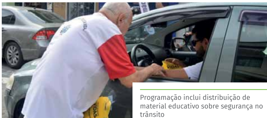
Programação inclui distribuição de material educativo sobre segurança no trânsito

O Dia do Motorista é comemorado no Dia de São Cristóvão, santo católico considerado o padroeiro dos motoristas brasileiros. Já o Dia do Motociclista, foi instituído a partir de uma sugestão da Associação Brasileira de Motociclista. A data escolhida marca, também, a morte do motociclista Marcus Bernardi, que faleceu em um acidente de trânsito no ano de 1974.