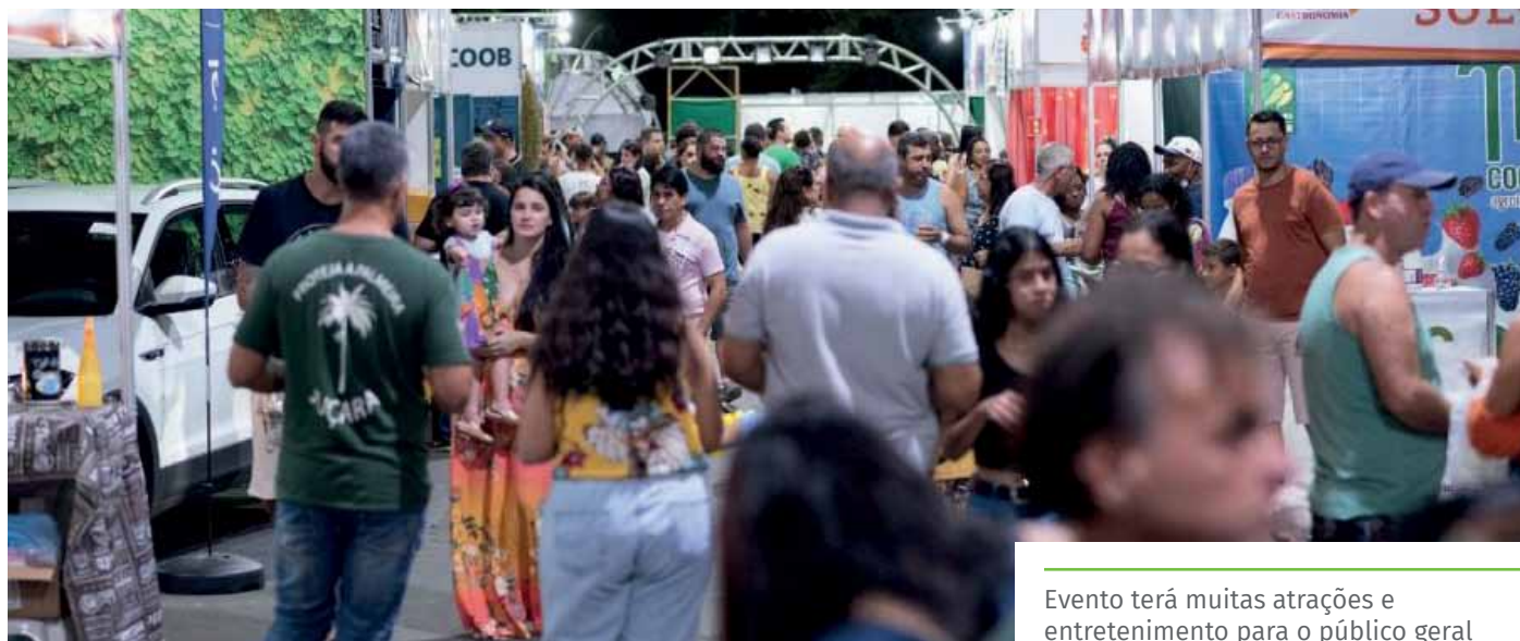
Evento terá muitas atrações e entretenimento para o público geral

“A edição 2022 marca o retorno da Exposul ao Parque de Exposições, após um intervalo de inviabilidade, em função da pandemia. Nesse período, realizamos edições setoriais e menores da feira. Agora, queremos fazer um evento maior, retomando, aos poucos, o porte que tinha na fase pré-pandemia”, afirma o prefeito de Cachoeiro, Víctor Coelho.