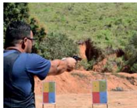
Atualmente, portam armas 41 guardas que concluíram o mesmo curso em 2018

delitos. Com mais guardas armados, fortaleceremos a segurança pública em Cachoeiro”, disse o prefeito Victor Coelho.