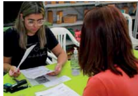
Atendimentos foram realizados na escola estadual “Wilson Rezende”

A gerência de Habitação da Semurb funciona na rua João Monteiro, 33, bairro Ferroviários, embaixo da Escola Municipal “Anacleto Ramos”. Mais esclarecimentos podem ser obtidos pelo telefone: (28) 3155-5200.