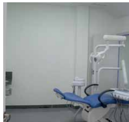
Odontologia é uma das especialidades que serão ofertadas no local

que mulheres de Cachoeiro poderão ser atendidas por profissionais dedicados, dando seu melhor para a promoção da