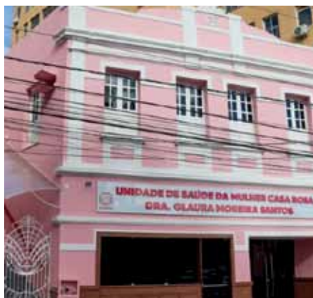
Local concentrará diversos serviços voltados ao público feminino

No local, serão ofertados serviços como salas para vacinas e testes rápidos, fisioterapia, odontologia, ultrassonografia, ginecologia, clínica geral, psicologia e nutrição, dentre várias outras áreas, além de um auditório para palestras.