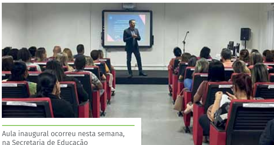
Aula inaugural ocorreu nesta semana, na Secretaria de Educação