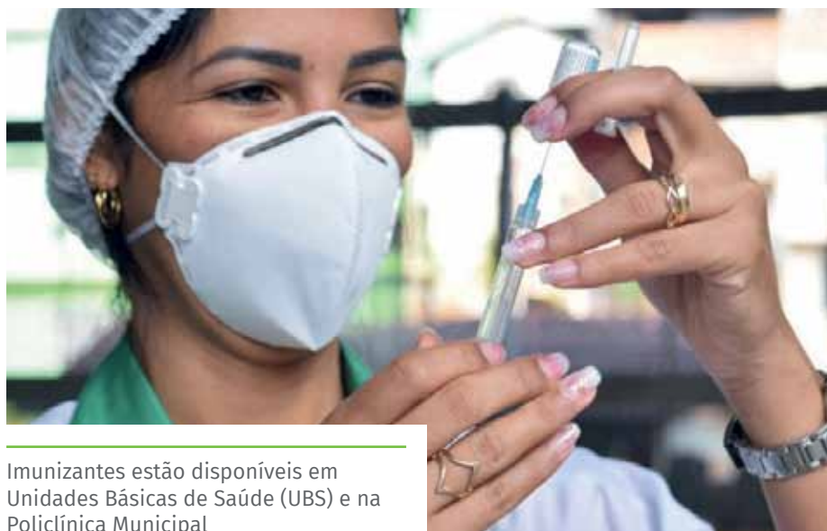
Imunizantes estão disponíveis em Unidades Básicas de Saúde (UBS) e na Policlínica Municipal

O imunizante pode ser encontrado em todas as salas de vacinação do município, com esquema vacinal de três doses.