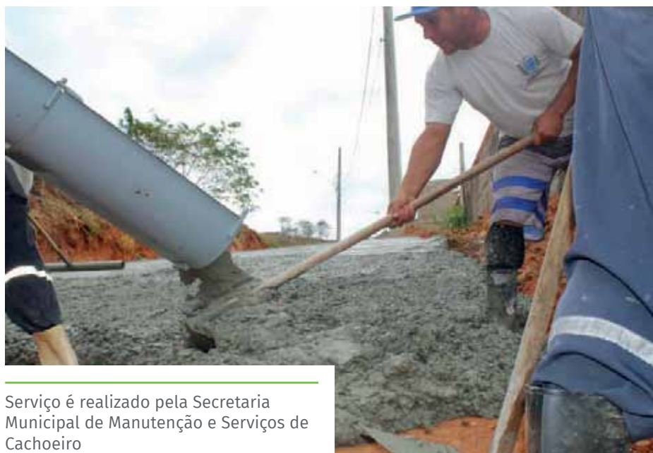
Serviço é realizado pela Secretaria Municipal de Manutenção e Serviços de Cachoeiro