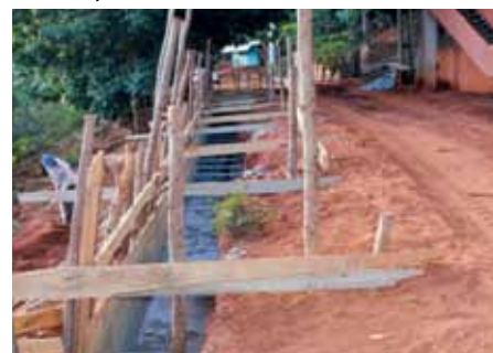
Muro de contenção está sendo construído na rua Wilson Duarte

Nesta quinta-feira (7), a Prefeitura autorizará o início da reforma e modernização do ginásio na orla do Rubem Braga, para implantação do Centro de Treinamento de Lutas do município.