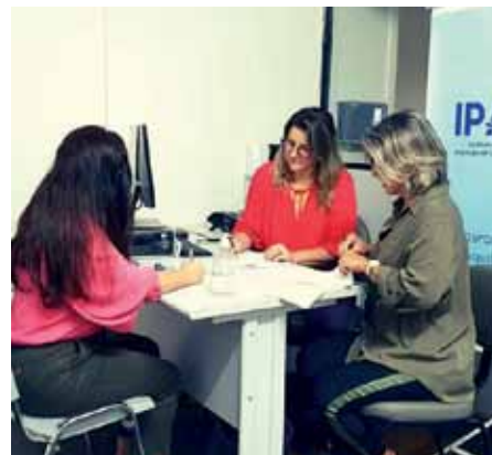
Inscrições de candidatos serão feitas até sexta (8), na sede do instituto

membros do Conselho Deliberativo do órgão, pode ser acompanhado pelo endereço www.ipaci.es.gov.br/eleicao-online .