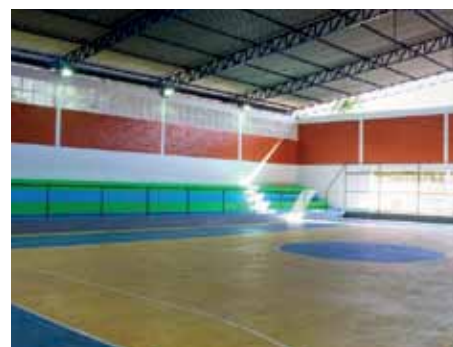
Renovado, espaço abrigará centro de treinamento de esportes adaptados para pessoas com deficiência

Além disso, também foram entregues itens que serão direcionados aos núcleos esportivos do bairro, como colchonetes, bambolês, bolas e cordas.