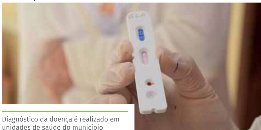
Diagnóstico da doença é realizado em unidades de saúde do município

importante que o paciente busque o teste para diagnosticar a Covid-19 e, em caso de resultado positivo, permaneça em isolamento, seguindo as orientações médicas. Além disso, é muito importante que a população mantenha os cuidados básicos contra a doença, como higienizar frequentemente as mãos, utilizar máscaras em ambientes fechados, manter o esquema vacinal atualizado e evitar aglomerações, sempre que possível”, destaca o secretário.