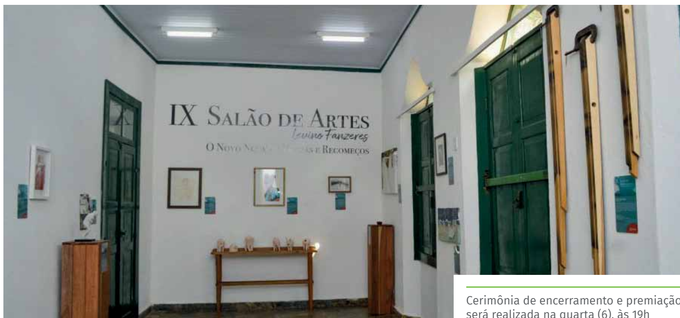
Cerimônia de encerramento e premiação será realizada na quarta (6), às 19h

Ainda jovem, Levino mudou-se para o Rio de Janeiro, para estudar no Liceu de Artes e Ofícios. Em 1910, ingressou na Escola Nacional de Belas Artes. No ano seguinte, participou, pela primeira vez, da Exposição Geral de Belas Artes. Em 1912, ganhou o prêmio de viagem à Europa com a tela Remorso de Judas. Morou quatro anos em Paris, onde teve aulas com expoentes da arte francesa e se especializou na pintura de paisagens. Em 1916, retornou ao Brasil, se consolidando como professor. Em 1921, recebeu a grande medalha de prata na Exposição Geral de Belas Artes. Há quadros seus nas coleções das prefeituras de Cachoeiro, de São Paulo, de Belém e de Belo Horizonte, assim como no Palácio Anchieta, sede do governo do Espírito Santo.