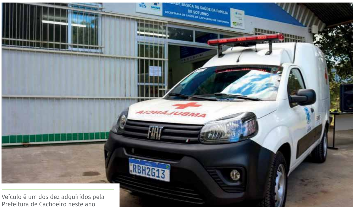
Veículo é um dos dez adquiridos pela Prefeitura de Cachoeiro neste ano

O investimento na aquisição dos veículos foi de R$ 1.751.500,00, obtidos a partir de um trabalho de recuperação de recursos de emendas parlamentares, referentes a saldos remanescentes do período de 2009 a 2020.