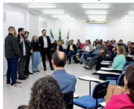
Servidores receberam treinamento para o uso do novo software

“Estamos trabalhando arduamente no presente, mas pensando também no futuro de Cachoeiro. Deixaremos para os próximos gestores um planejamento organizado, com ferramentas, dados e todas as condições para que ações importantes para a população não sejam interrompidas a cada mudança”, frisa.