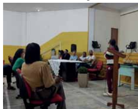
Formação foi realizada na terça (28), Dia Mundial do Orgulho LGBTQIA+