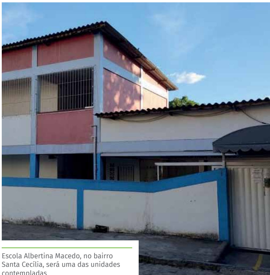
Escola Albertina Macedo, no bairro Santa Cecília, será uma das unidades contempladas

Além disso, também em abril, foi assinada a ordem de serviço para a reforma da escola municipal “Anacleto Ramos” e anunciada a reforma e ampliação da escola Zilma Coelho Pinto, ambas no bairro Ferroviários.