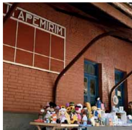
Público pode conferir as atrações no local das 9h às 17h

O evento tem, ainda, atividades presenciais em escolas e atrações on-line, como as mesas de lançamento de livros e de debates literários, com a participação de escritores renomados. Confira a programação completa do evento no site www.cachoeiro.es.gov.br .