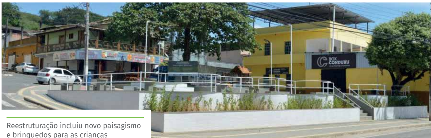
Reestruturação incluiu novo paisagismo e brinquedos para as crianças

A Prefeitura de Cachoeiro investiu R$ 169 mil na obra, recursos captados junto ao Ministério do Desenvolvimento Regional e Caixa Econômica Federal.