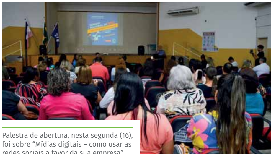
Palestra de abertura, nesta segunda (16), foi sobre “Mídias digitais – como usar as redes sociais a favor da sua empresa”