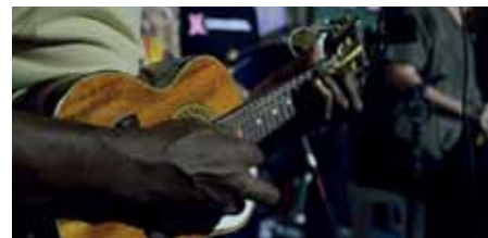
Músicos se apresentarão no Circo da Cultura, com entrada franca

A primeira apresentação ocorreu no dia 6 de maio, com grupo de seresta liderado pelo músico Edgar Pinheiro. Participam da iniciativa artistas selecionados via edital de credenciamento (Semcult 004/2021).