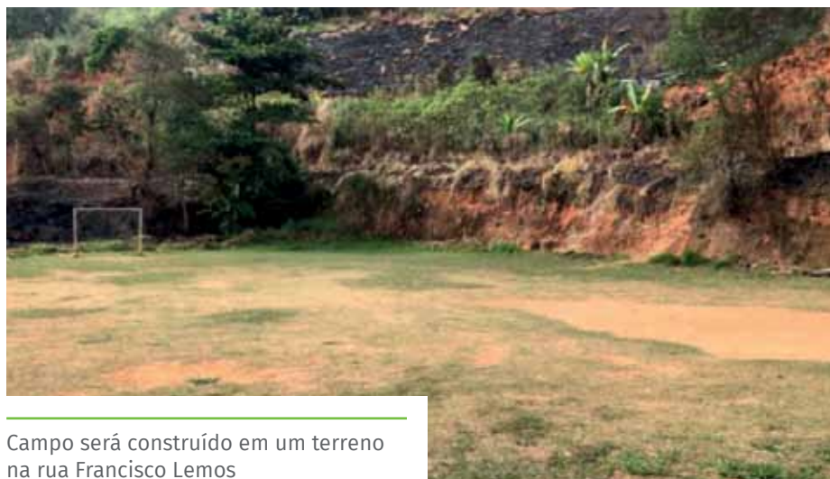
Campo será construído em um terreno na rua Francisco Lemos

Os itens, entregues por meio do Programa Campeões do Futuro, do Governo do Estado, incluem: bolas, redes, pratos demarcatórios, cones, apitos, cronômetros digitais, bombas, bico e agulhas, calibradores digitais, arcos, bolas, fitas, maçãs, sapatilhas, estiletes, cordas, hidro tubo, flutuador, pranchas, toucas, óculos, apito, cronômetros digitais, tatames, protetor de tórax, aparador de chutes e quimonos. A expectativa é de beneficiar até 500 crianças e adolescentes.