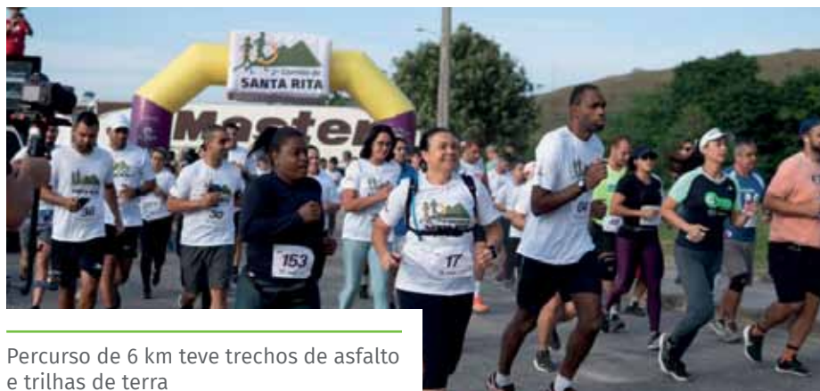
Percurso de 6 km teve trechos de asfalto e trilhas de terra

Em abril, a Semesp doou para a Santa Casa de Misericórdia os pacotes de fraldas arrecadados junto aos participantes de outros dois eventos esportivos: a Temporada de Areia, que ocorreu em fevereiro e março, e a Corrida da Mulher, em março.