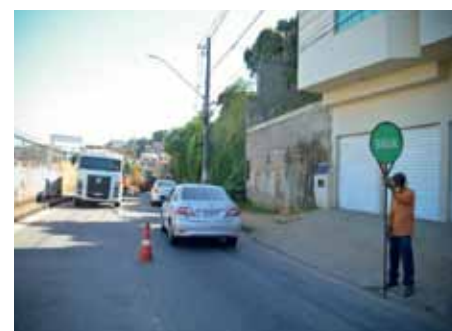
Trânsito no local está funcionando no sistema pare e siga