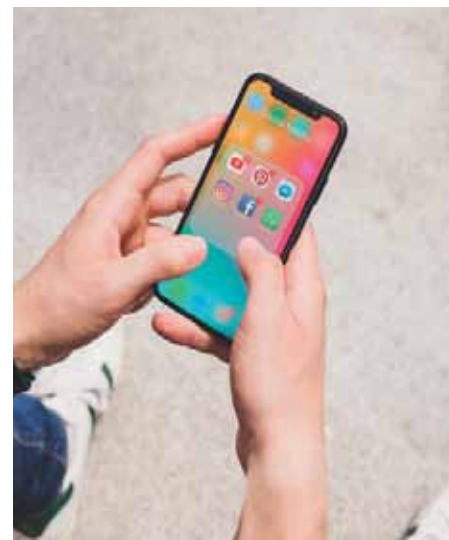
Evento será realizado no auditório da escola municipal Zilma Coelho Pinto

Veja o cronograma de palestras no site: https://www.cachoeiro.es.gov.br/noticias/palestra-sobre-midias-sociais-abrira-semana-do-microempreendedor-em-cachoeiro/