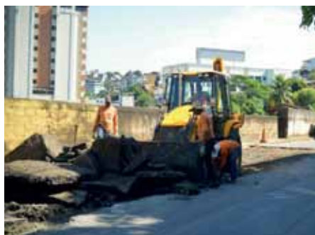
Ação faz parte do programa de recuperação de vias do município

Iniciados na última segunda-feira (9), os serviços estão previstos para