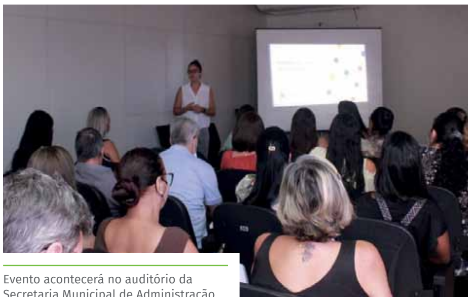
Evento acontecerá no auditório da Secretaria Municipal de Administração