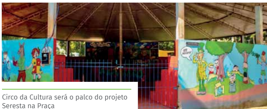
Circo da Cultura será o palco do projeto Seresta na Praça

Além da primeira apresentação de seresta, quem for conferir o evento vai poder curtir uma feira de artesanatos cachoeirenses realizada na Praça de Fátima, sob organização da Prefeitura e instituições parceiras.