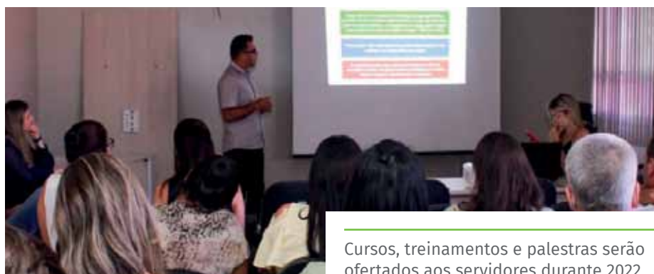
Cursos, treinamentos e palestras serão ofertados aos servidores durante 2022