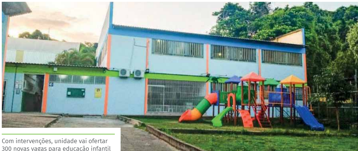
Com intervenções, unidade vai ofertar 300 novas vagas para educação infantil

Além disso, também em abril, foi assinada a ordem de serviço para reforma da escola municipal “Anacleto Ramos”, no bairro Ferrovários.