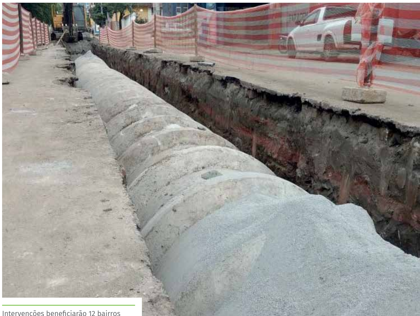
Intervenções beneficiarão 12 bairros

A assinatura do convênio foi realizada em solenidade no Hospital Evangélico de Cachoeiro. Na ocasião, também foram anunciados recursos estaduais para construção do Hospital do Câncer no município e para reforma e ampliação da escola municipal Zilma Coelho Pinto.