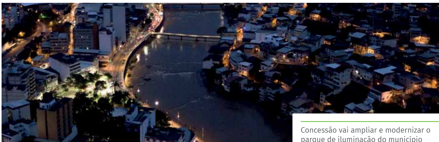
Concessão vai ampliar e modernizar o parque de iluminação do município