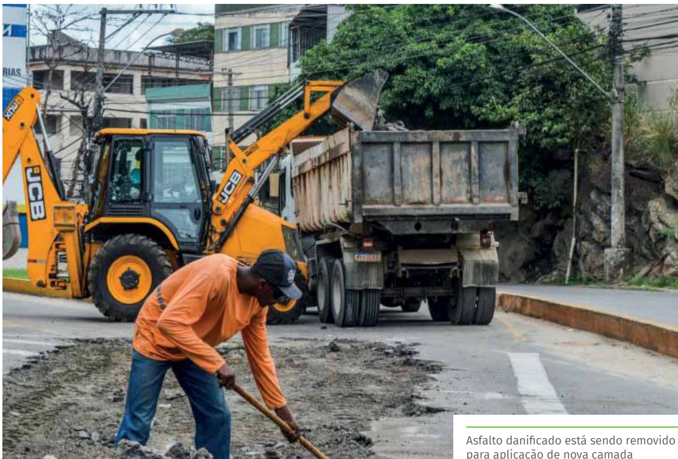
Asfalto danificado está sendo removido para aplicação de nova camada

As obras de recapeamento na Jones dos Santos Neves fazem parte de um programa de recuperação de ruas e avenidas do município. No total, 19 vias públicas de Cachoeiro serão contempladas com os serviços, que já alcançaram as ruas Joana Carlete Fiorio e Domingos Alcino Dadalto, além da avenida Fioravante Cipriano e um trecho da Linha Vermelha. O investimento nessas obras é de R$ 11,7 milhões, com recursos do Governo do Estado do Espírito Santo.