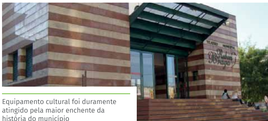
Equipamento cultural foi duramente atingido pela maior enchente da história do município

Nos próximos meses, o Museu Ferroviário Domigos Lage e o Centro Cultural Mestre Salatiel receberão obras de manutenção.