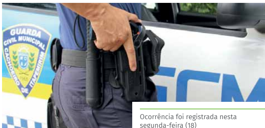
Ocorrência foi registrada nesta segunda-feira (18)