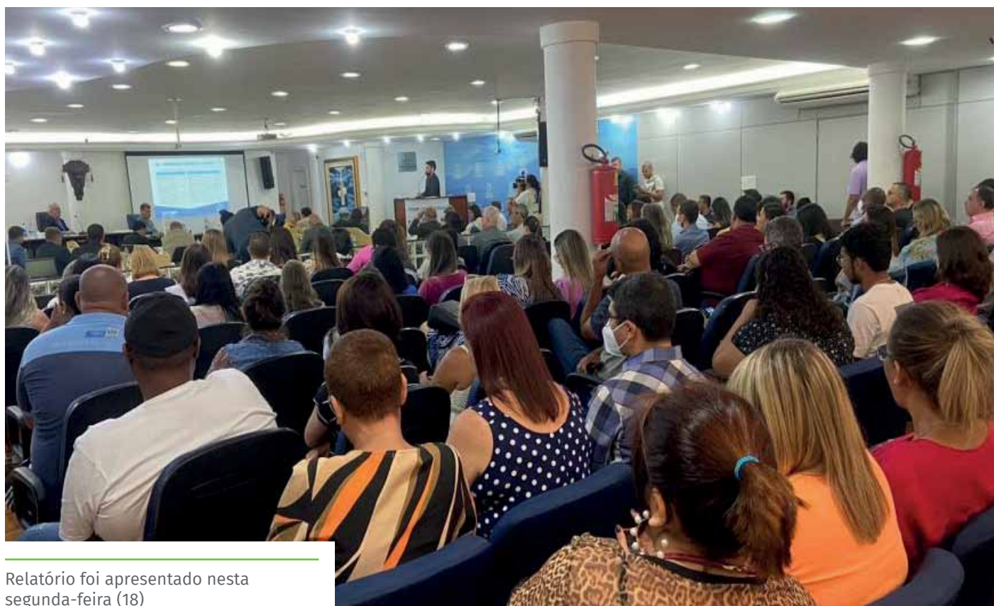
Relatório foi apresentado nesta segunda-feira (18)

O vídeo da audiência está disponível, na íntegra, no canal de YouTube da Câmara Municipal e a prestação de contas de 2021 pode ser acessada no portal da Prefeitura de Cachoeiro – www.cachoeiro.es.gov.br/prestacao-de-contas .