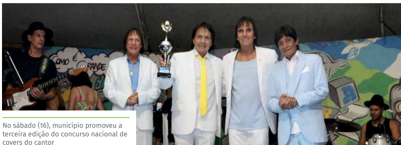
No sábado (16), município promoveu a terceira edição do concurso nacional de covers do cantor