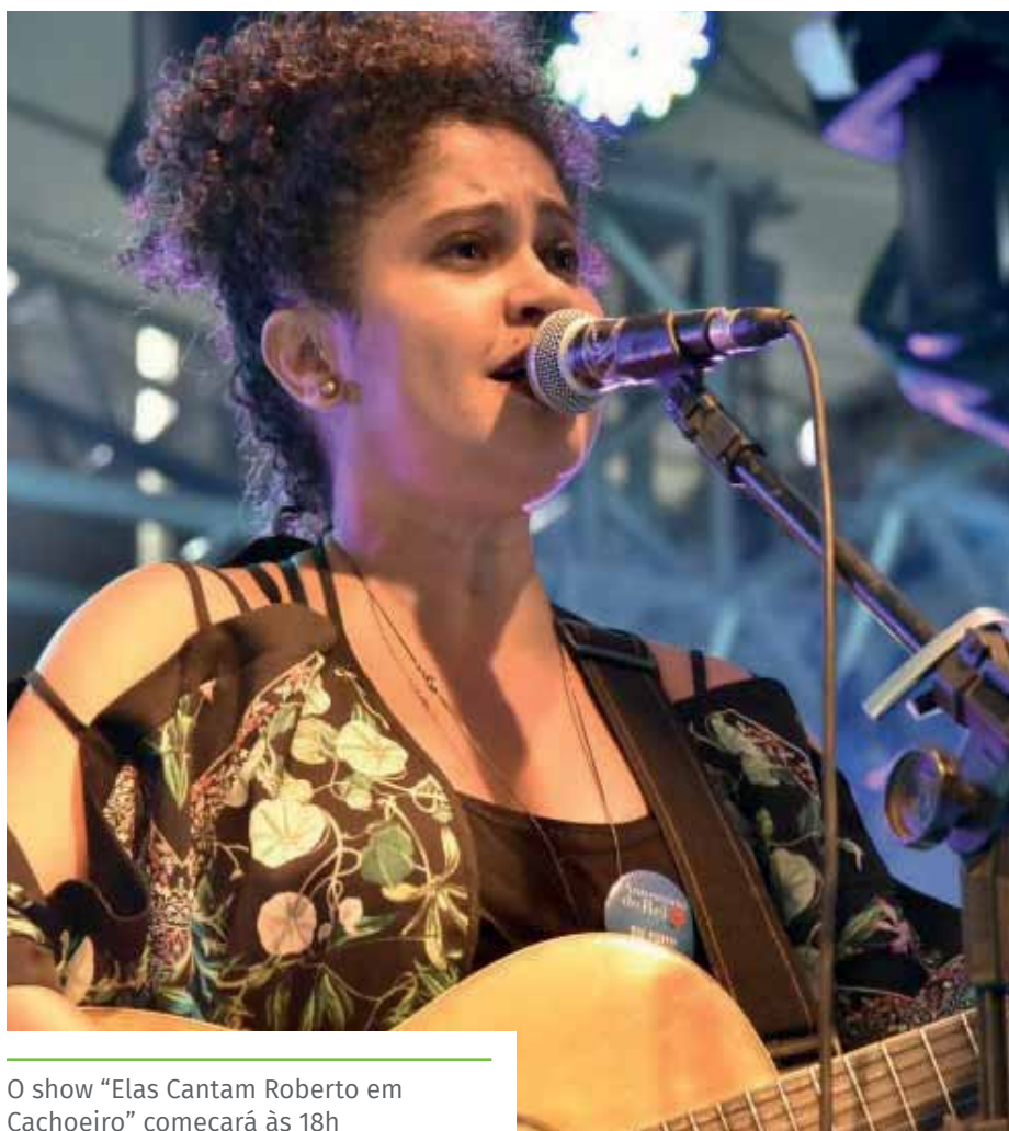
O show “Elas Cantam Roberto em Cachoeiro” começará às 18h

As primeiras atividades realizadas pela Semcult por meio do Aniversário do Rei 2022 foram o quiz sobre Roberto Carlos com alunos de escolas municipais, concurso nacional “Minha História com o Rei” e concurso Miss Jovem Guarda Cachoeiro.