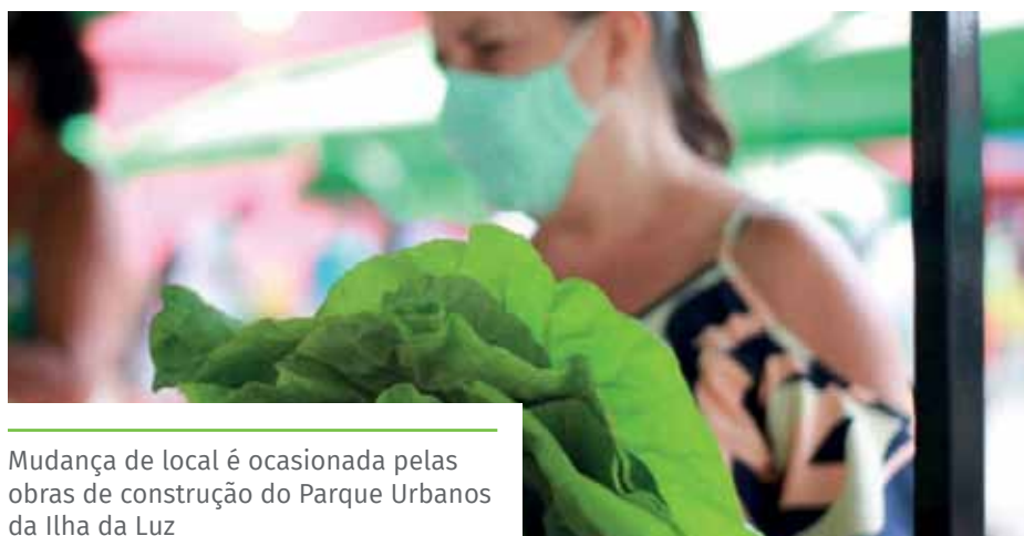
Mudança de local é ocasionada pelas obras de construção do Parque Urbanos da Ilha da Luz