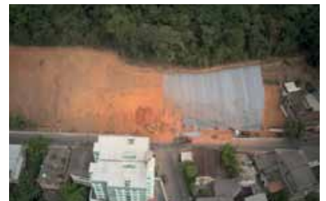
Obra é realizada em encosta localizada na rua Jerônimo Ribeiro

“Ao trazer essa técnica para Cachoeiro, estamos fortalecendo e diversificando a nossa política pública de prevenção de desastres. Já fizemos e seguiremos fazendo muitas obras de contenção, que são primordiais para garantir mais segurança à população”, afirma.