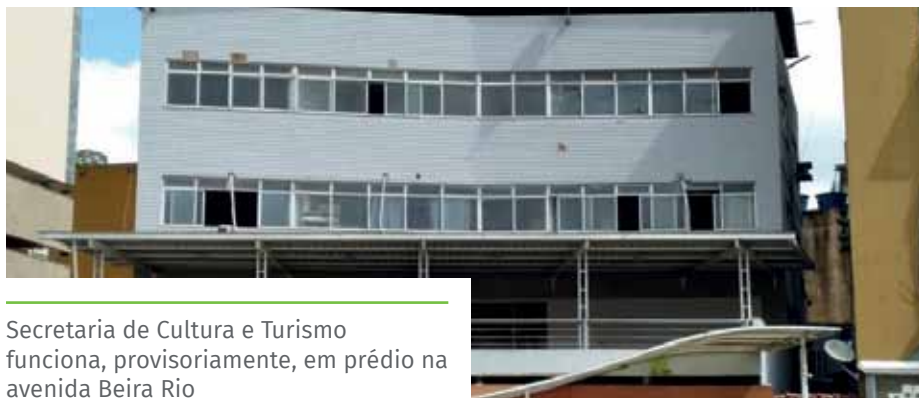
Secretaria de Cultura e Turismo funciona, provisoriamente, em prédio na avenida Beira Rio

A mudança é definitiva, já que a Ilha da Luz será transformada em parque urbano. As sedes da Guarda Civil Municipal e da Defesa Civil, instaladas no local, também serão transferidas, em breve.