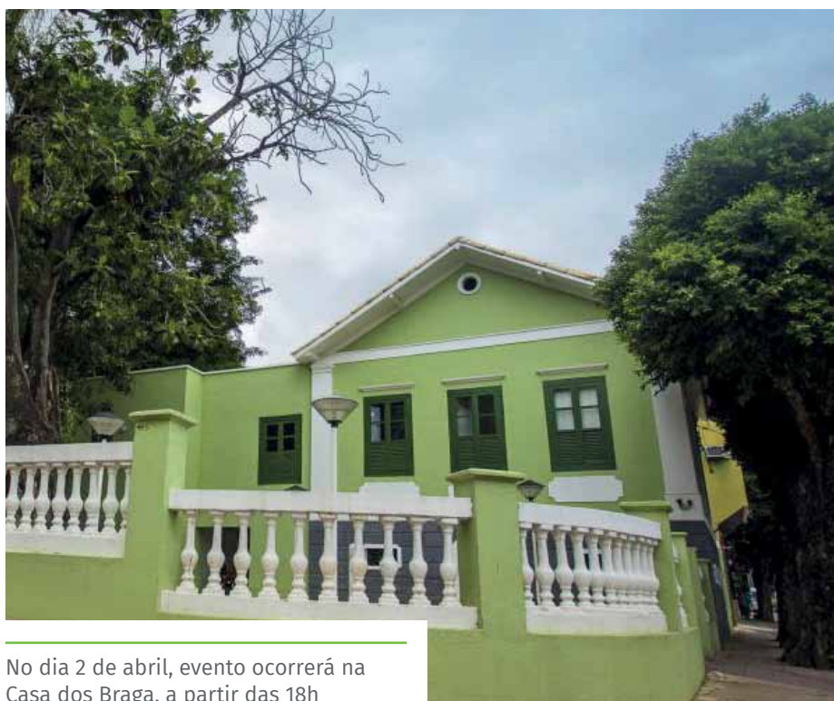
No dia 2 de abril, evento ocorrerá na Casa dos Braga, a partir das 18h