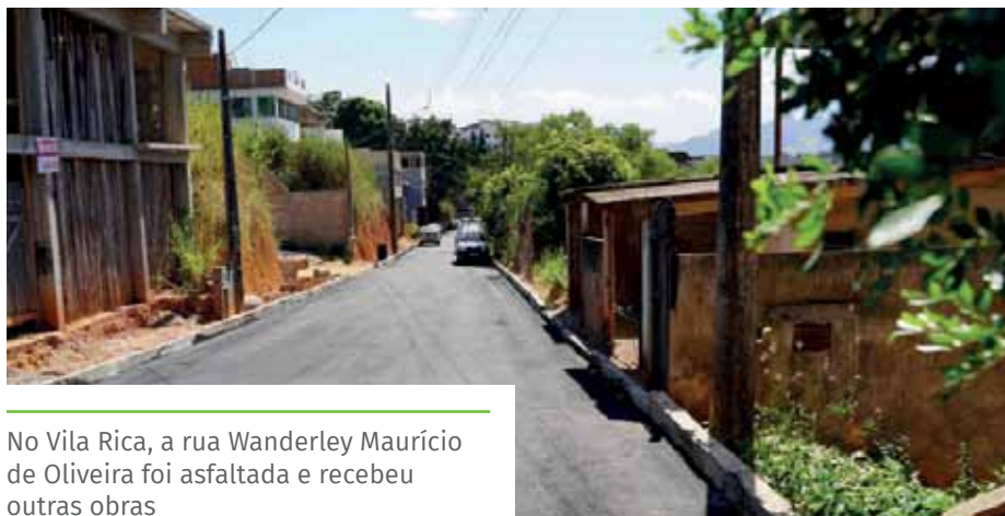
No Vila Rica, a rua Wanderley Maurício de Oliveira foi asfaltada e recebeu outras obras

Também na semana passada, a Semmat realizou pavimentação com concreto na rua Pedro Gardioli, no bairro Novo Parque.