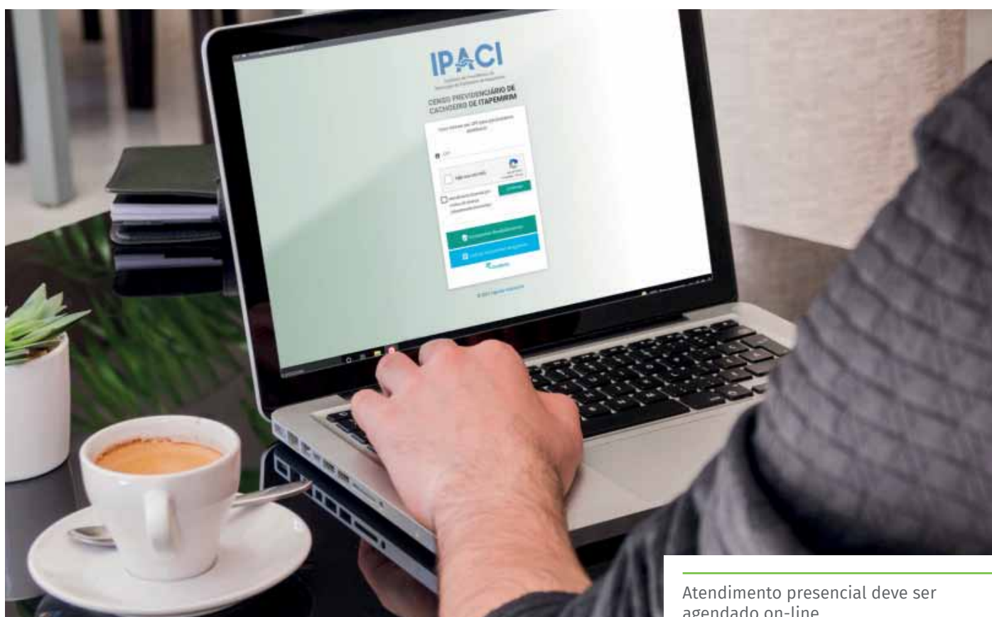
Atendimento presencial deve ser agendado on-line

Entre as vantagens do novo sistema, está a possibilidade de realização de diversas ações pela internet, sem necessidade de deslocamento do segurado até o IPACI, como recadastramento anual de dados. Por meio do aplicativo, os segurados também poderão fazer a simulação de benefícios (como regras de aposentadoria) e, no caso dos aposentados e pensionistas, prova de vida por meio de biometria facial.