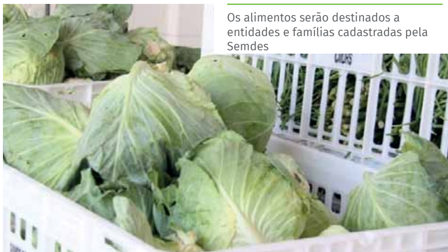
Os alimentos serão destinados a entidades e famílias cadastradas pela Semdes