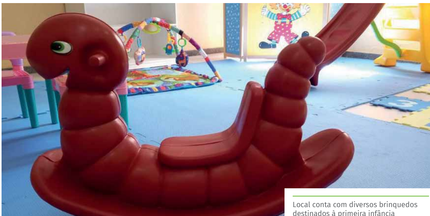
Local conta com diversos brinquedos destinados à primeira infância

A principal ação do programa é a realização de atendimentos domiciliares, com ações presenciais e remotas, atuando sob as perspectivas da prevenção, proteção e promoção do desenvolvimento infantil.