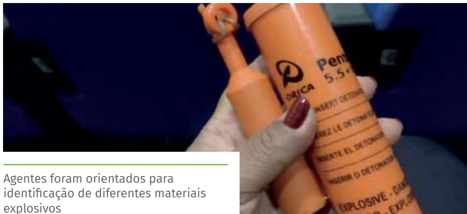
Agentes foram orientados para identificação de diferentes materiais explosivos

inicial às forças policiais que têm a competência funcional e operacional para atender esse tipo de ocorrência e, principalmente, zelando pela proteção e integridade das pessoas no local”, afirma.