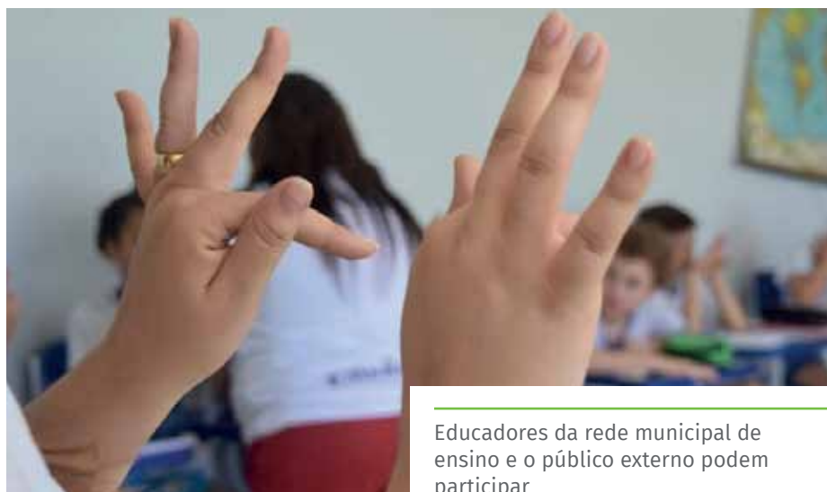
Educadores da rede municipal de ensino e o público externo podem participar