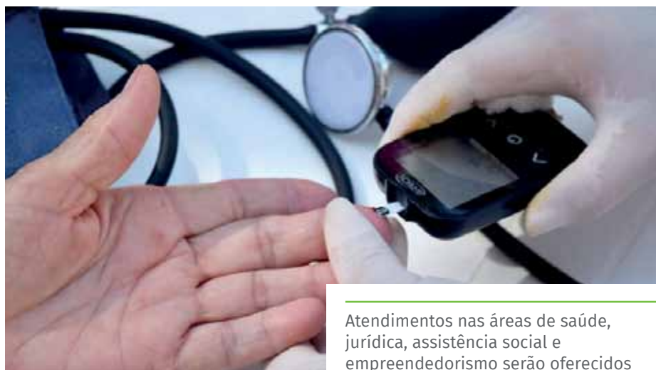
Atendimentos nas áreas de saúde, jurídica, assistência social e empreendedorismo serão oferecidos

A partir das 19h, na quadra da Associação de Moradores do bairro Amarelo (Amobam), as mulheres começarão as disputas pelos títulos nas modalidades de voleibol de areia e beach tennis. Os portões serão abertos ao público às 18h30. A entrada é gratuita.