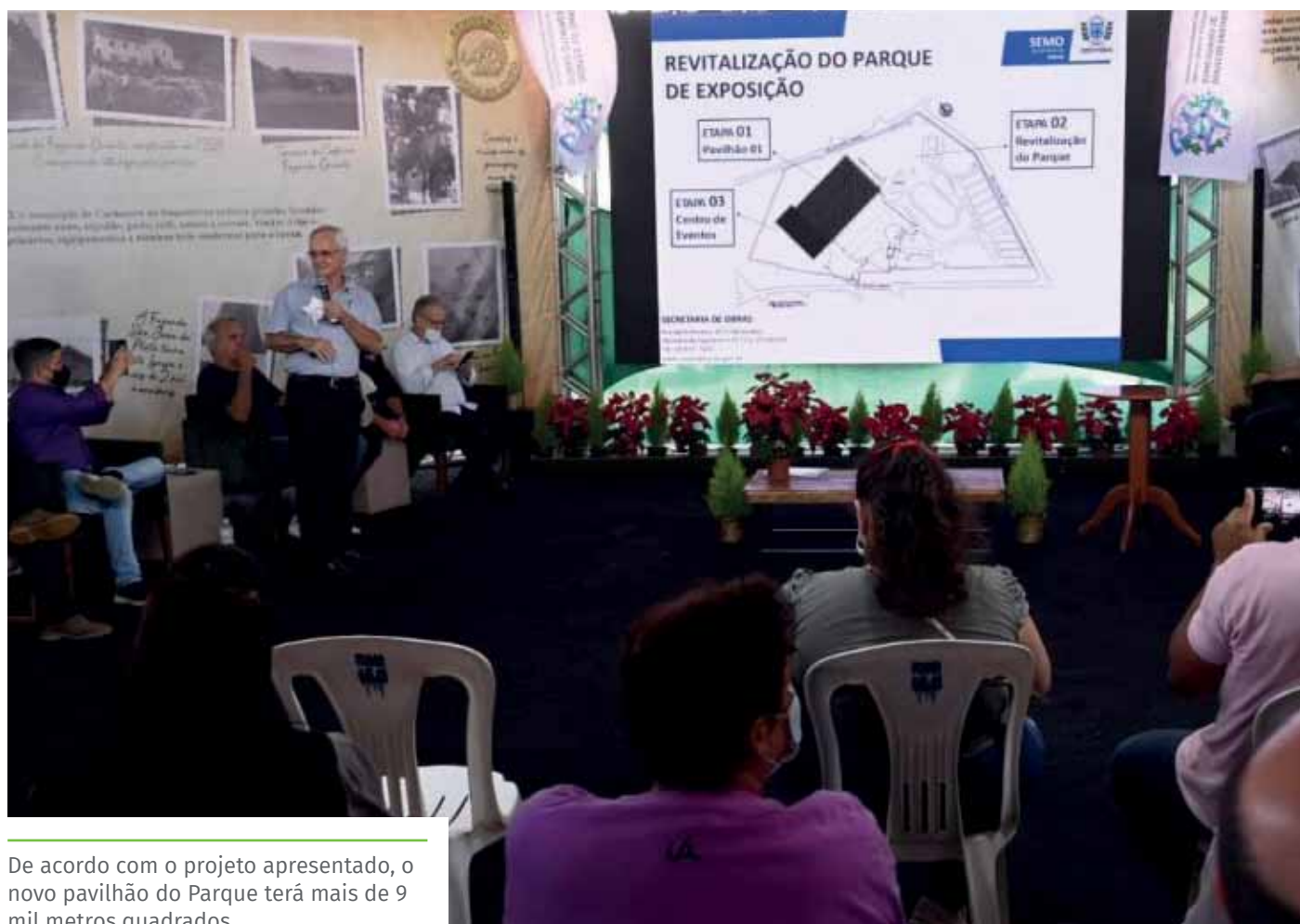
De acordo com o projeto apresentado, o novo pavilhão do Parque terá mais de 9 mil metros quadrados

“O Parque de Exposição tem grande importância no cenário econômico de Cachoeiro, pois recebe visitantes de todo o mundo nos eventos realizados nesse local. É importante que os expositores e organizadores de eventos tenham uma estrutura adequada para promoverem seus negócios”, afirmou o prefeito Victor Coelho.