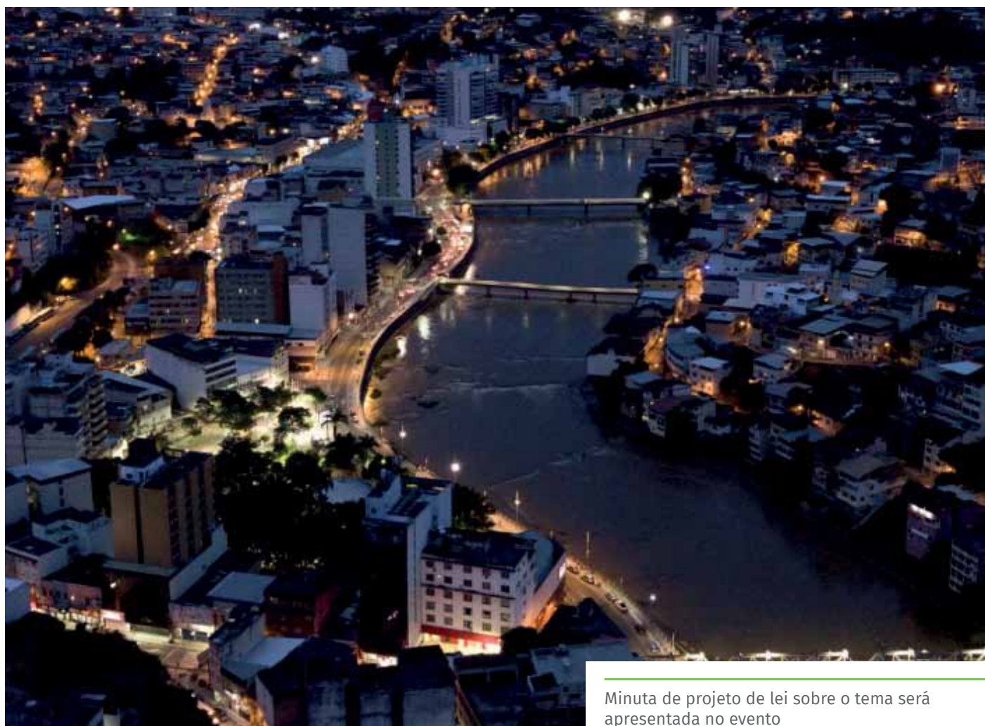
Minuta de projeto de lei sobre o tema será apresentada no evento

Para acompanhar a audiência pública de forma on-line, será preciso acessar o site da Prefeitura de Cachoeiro ( www.cachoeiro.es.gov.br ) e clicar no banner do evento, na página principal.