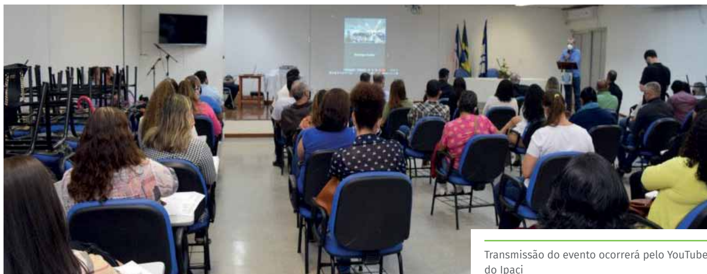
Transmissão do evento ocorrerá pelo YouTube do Ipaci