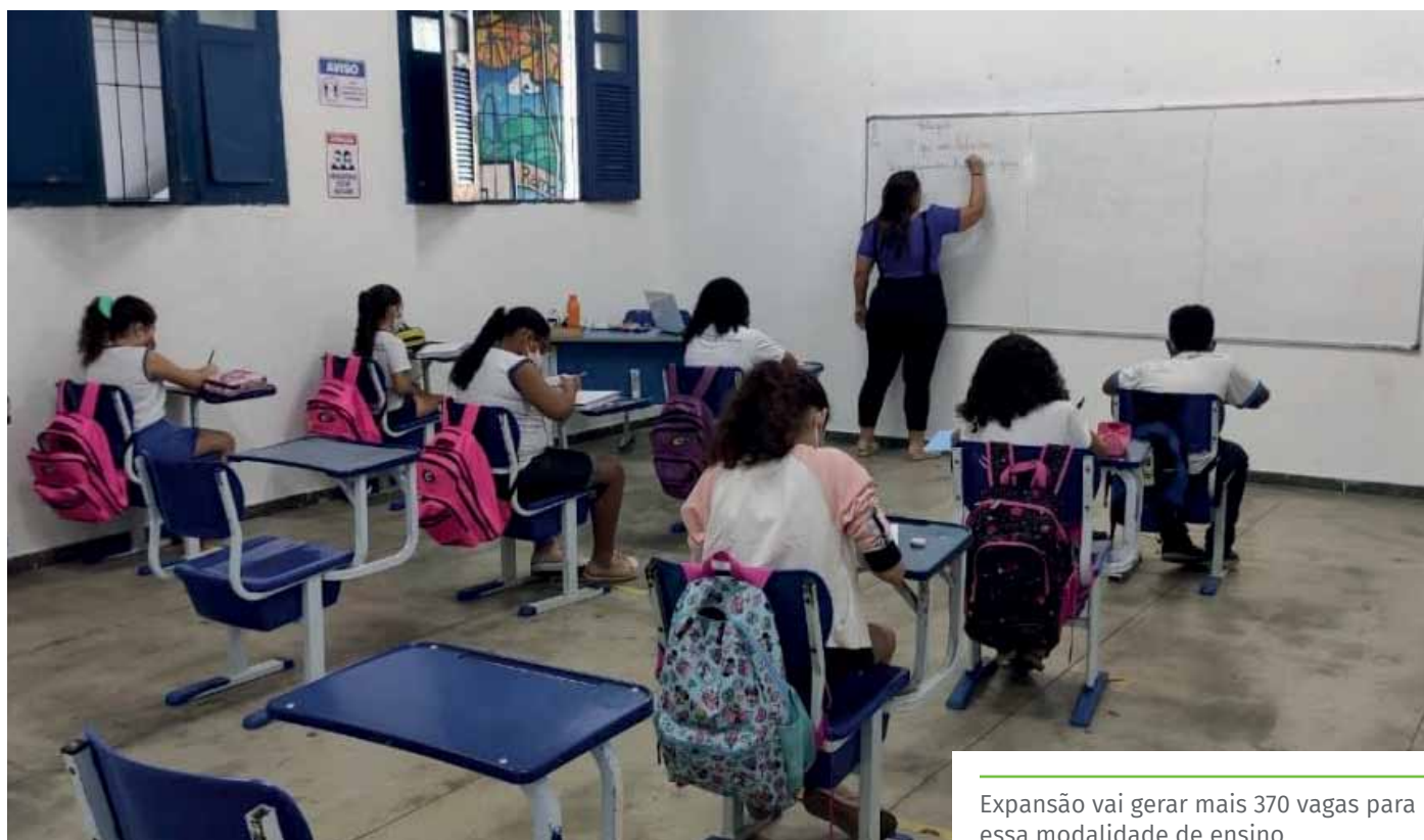
Expansão vai gerar mais 370 vagas para essa modalidade de ensino