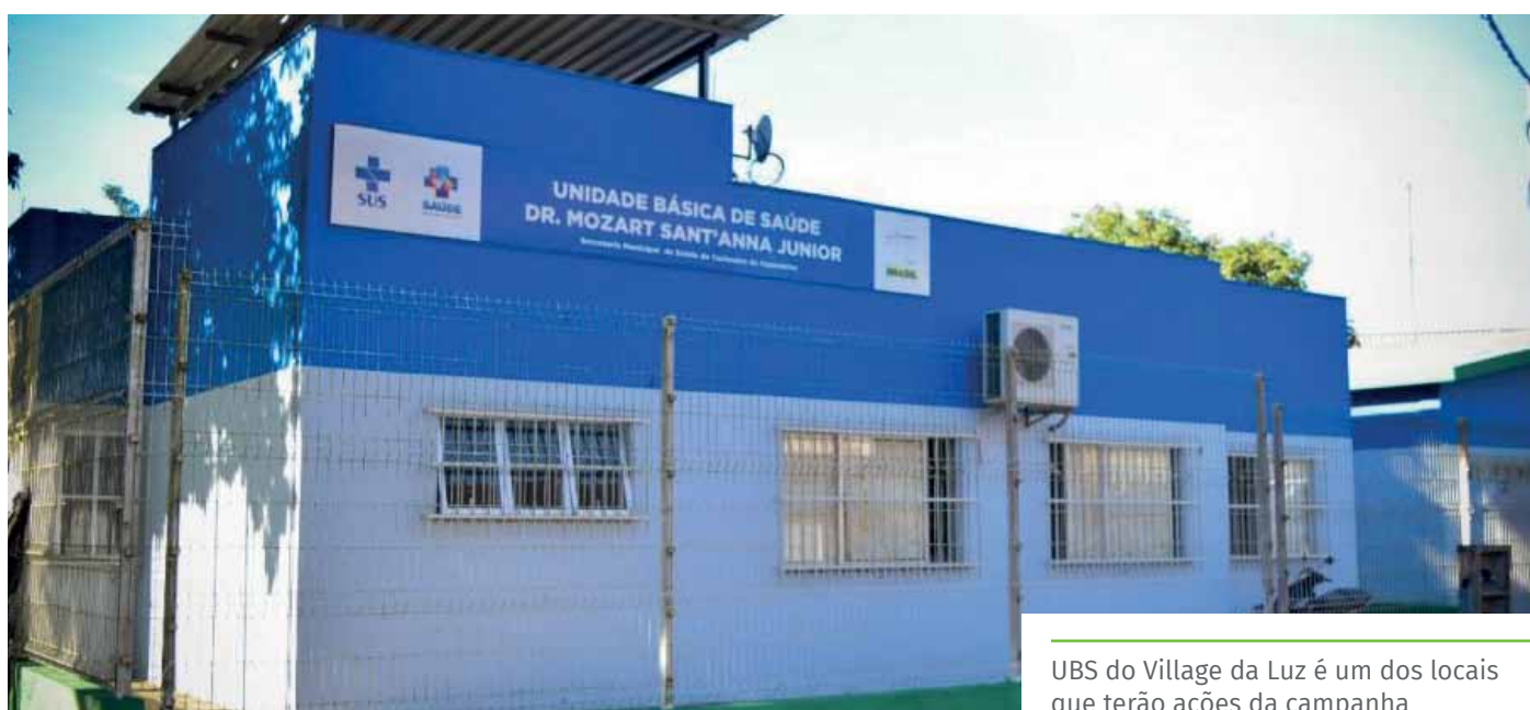
UBS do Village da Luz é um dos locais que terão ações da campanha

UBS Paraíso – 13h – Palestra sobre o tema da campanha.