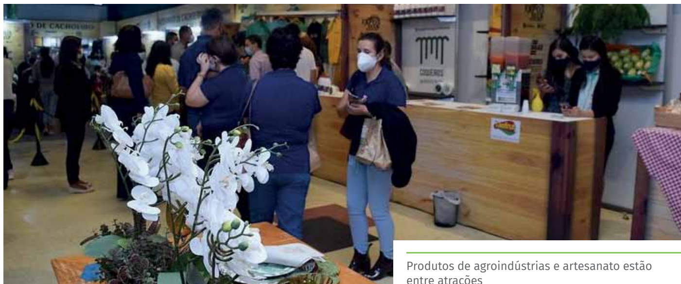
Produtos de agroindústrias e artesanato estão entre atrações

O evento será aberto ao público das 14h às 22h, na quinta e na sexta-feira. No sábado, das 10h às 22h. A entrada e o estacionamento são gratuitos. Serão cumpridos todos os protocolos sanitários, durante o evento.