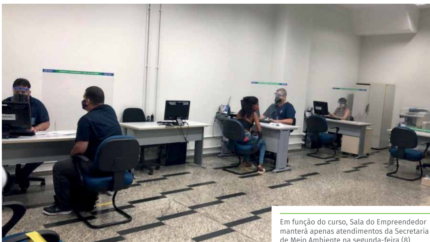
Em função do curso, Sala do Empreendedor manterá apenas atendimentos da Secretaria de Meio Ambiente na segunda-feira (8)

As ações serão realizadas dentro de nove eixos: Gestão Pública Empreendedora; Desburocratização; Compras Governamentais; Inovação; Inclusão Produtiva; Liderança e Território; Educação Empreendedora; Sala do Empreendedor e Projetos Especiais.