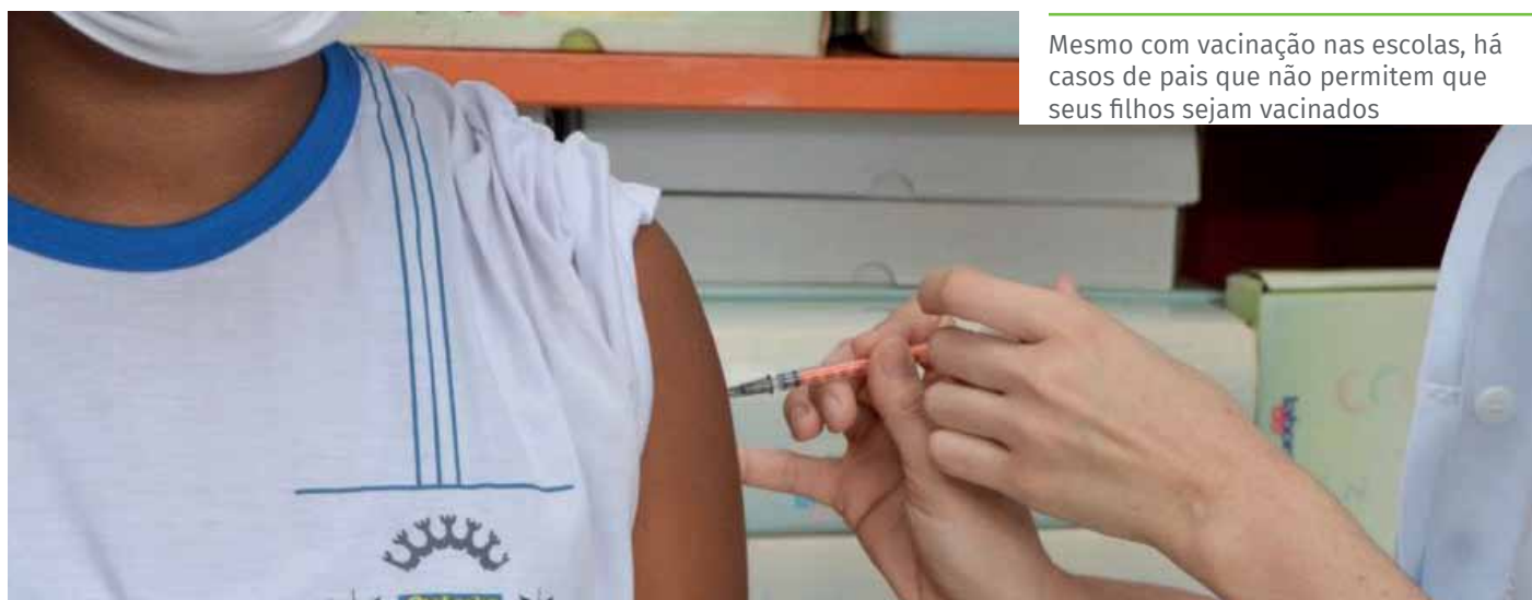
Mesmo com vacinação nas escolas, há casos de pais que não permitem que seus filhos sejam vacinados

Para receber a vacina, é necessário mostrar documento de identidade, cartão de vacinas e cartão do SUS ou CPF.