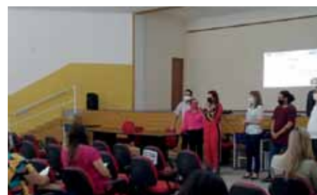
Gestores e coordenadores de escolas municipais participaram da atividade

Para denúncias de casos de violência contra a mulher, a orientação é acionar a Delegacia Especializada de Atendimento à Mulher de Cachoeiro, que fica na rua Coelho Melo, nº 1, no bairro Independência, em frente ao Fórum, e atende pelo telefone 3155-5084. Outro canal de denúncia é o telefone 180 (Central de Atendimento à Mulher).