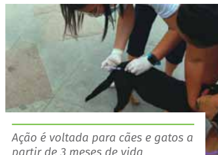
Ação é voltada para cães e gatos a partir de 3 meses de vida

Confira os locais de vacinação no dia 16/10, no portal: www.cachoeiro.es.gov.br/noticias .