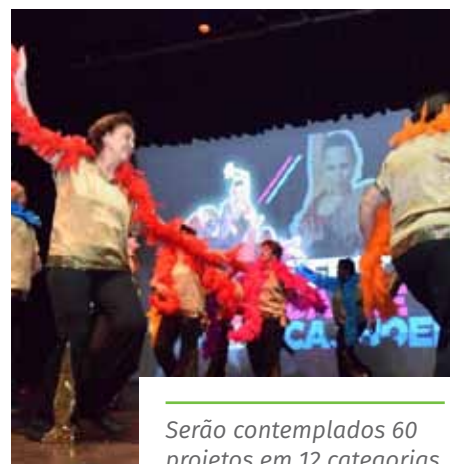
Serão contemplados 60 projetos em 12 categorias