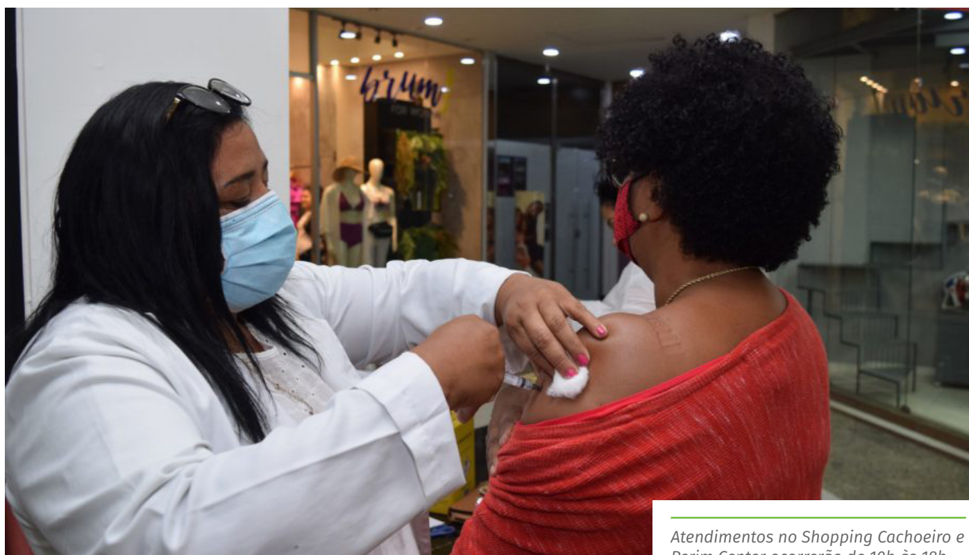
Atendimentos no Shopping Cachoeiro e Perim Center ocorrerão de 10h às 18h

As pessoas que se vacinam contra a Covid-19, em Cachoeiro, podem colaborar com a campanha “Compartilhe Amor”, doando, no momento da vacinação na unidade de saúde, alimentos não perecíveis e itens de higiene (álcool em gel e sabão), na quantidade que quiserem. A Prefeitura destina todos os produtos arrecadados a famílias em situação de vulnerabilidade social, para reforçar as ações de combate à insegurança alimentar no município durante a pandemia.