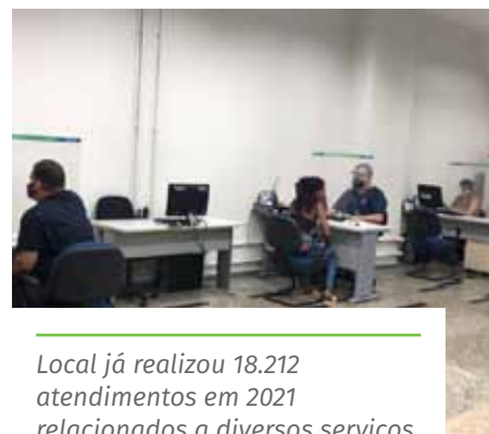
Local já realizou 18.212 atendimentos em 2021 relacionados a diversos serviços

Para dúvidas ou informações, é possível entrar em contato com a Sala do Empreendedor pelo telefone (28) 3155-5292.