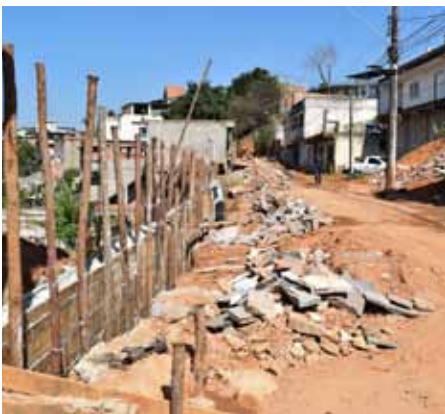
A rua Carolina Perim recebeu pavimentação com concreto

A equipe ainda realizou limpeza e preparo da rua Sebastião Carreiro, no Jardim Itapemirim, para revestimento asfáltico.