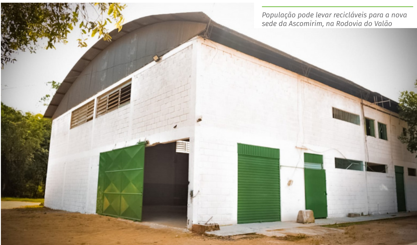
População pode levar recicláveis para a nova sede da Ascomirim, na Rodovia do Valão

O lixo úmido, o que inclui: restos de alimentos; cascas de frutas; fitas adesivas, resíduos de jardinagem, papel higiênico e fraldas descartáveis; pratos e copos descartáveis; pó de café, embalagens de marmítex; guardanapos.