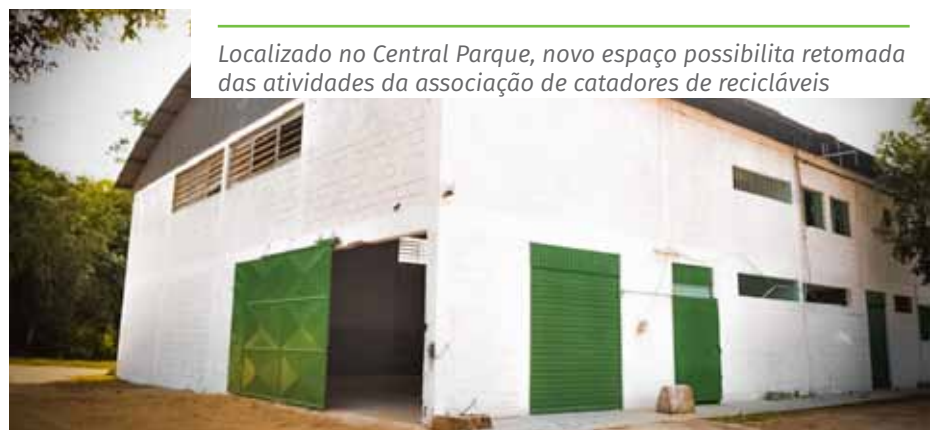
Localizado no Central Parque, novo espaço possibilita retomada das atividades da associação de catadores de recicláveis

A separação de materiais recicláveis é fundamental para evitar desperdícios, tornando possível um melhor aproveitamento das matérias primas extraídas do meio ambiente. Quando não descartados corretamente, os resíduos levam décadas ou até séculos para alcançar sua decomposição total. Dessa forma, além de auxiliar na manutenção de uma cidade mais sustentável, a reciclagem ainda ajuda com a geração de renda, visto que há indústrias específicas neste ramo. Em Cachoeiro, a Ascomirim é responsável pelo tratamento adequado para a comercialização do material recolhido.