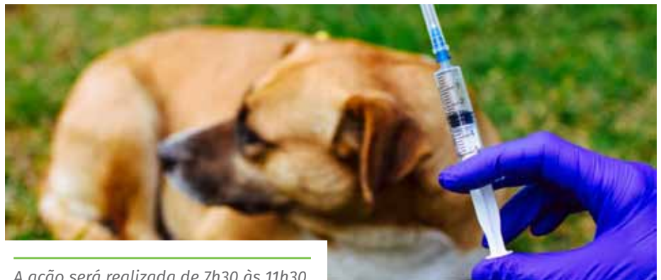
A ação será realizada de 7h30 às 11h30

Além disso, serão realizados mutirões. Nos dias 16 e 23 de outubro, serão instalados cerca de 30 pontos de imunização em locais estratégicos dos bairros, para facilitar o acesso. Os locais serão divulgados em breve.