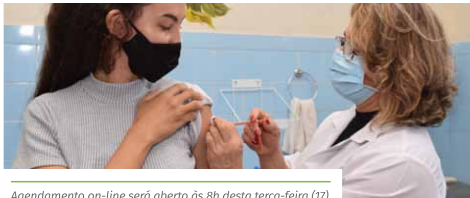
Agendamento on-line será aberto às 8h desta terça-feira (17)

As pessoas que se vacinam contra a Covid-19, em Cachoeiro, podem colaborar com a campanha “Compartilhe Amor”, doando, no momento da vacinação na unidade de saúde, alimentos não perecíveis e itens de higiene (álcool em gel e sabão), na quantidade que quiserem. A Prefeitura destina todos os produtos arrecadados a famílias em situação de vulnerabilidade social, para reforçar as ações de combate à insegurança alimentar no município durante a pandemia.